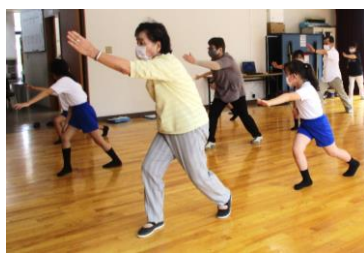
R2 2年公民館たんけん