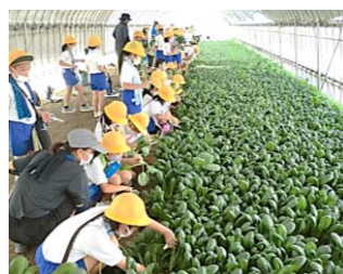
R2 3年小松菜づくり見学