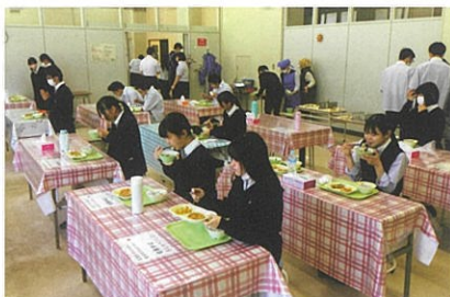
ランチルームの様子