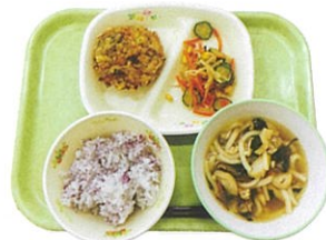
献立メニューの一例