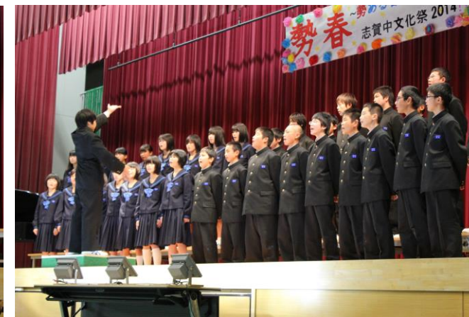
1の1 自由曲 君をのせて