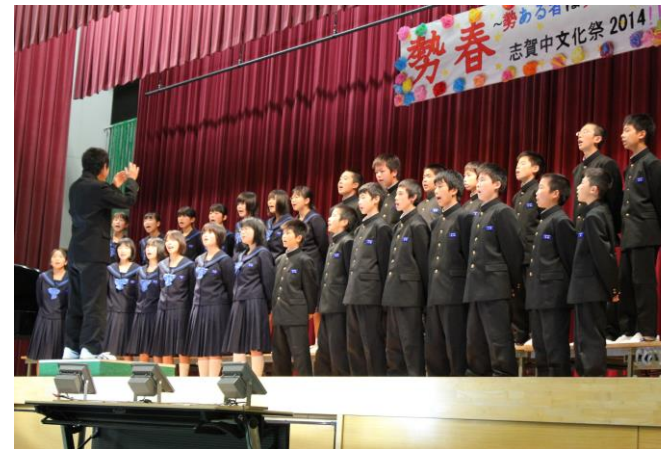
1の3 自由曲 手紙 ～拝啓 十五の君へ～