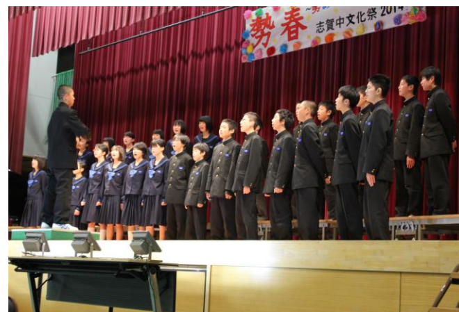
1の4 自由曲 COSMOS