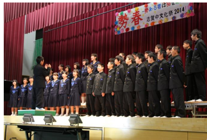
1の2 自由曲 花は咲く