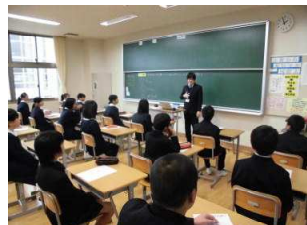
小学6年生授業体験

11月18日。来年度の入学を見据え、中学校生活を体験するため小中連携事業が開催されました。当日は7つの小学校から6年生106名が志賀中を訪れ、授業体験や部活動参観を行いました。これを迎える1・2年生も部活動では先輩らしく、いつもよりきびきびと行動していました。6年生には「いじめを産み出す弱い心や怠けてしまうずるい心から卒業し、一生懸命・感謝・思いやりの3つの心だけ小学校から持ってくる」という約束をしました。これは、今の中学生にも大切なことです。「挨拶・返事・掃除」の当たり前のことも含めて自分達はできているか。2学期を締めくくる今、小学生に笑われないようにしっかりと確認したいものです。3年生も受験で大変だと思いますが、何から卒業し、何を持って高校等の次のステージに進むのか。じっくり考えて、残りの日々を大切にしたいです。