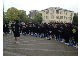
平和公園での平和集会

4月20日。修学旅行・金沢自主プラン・校外学習を通して、志賀中の躍動が始まりました。3年生は広島での平和学習や被爆者証言講話において、現地ガイドや講師の方々から「聴く態度が素晴らしい」と褒めて頂きました。また、しっかりした集団規律だけでなく、仲間を思いやる行動も随所に見られ、意識の高さを証明してくれました。2年生の金沢自主プランでも、きちんとした行動でジョブカフェの方に評価されました。来年の修学旅行が楽しみです。1年生は鹿島少年自然の家の方に「校歌の声が大きく爽やか」と褒められました。各々の学年が課題をクリアし、絆を深めました。5月は、郡市総合体育大会や唐山相撲大会と行事が目白押しです。新しい絆を軸に、生徒パワー全開の5月にしましょう。