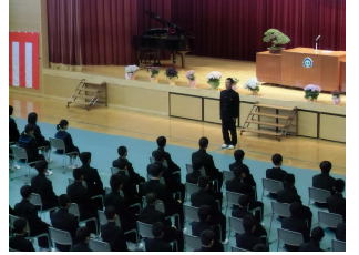
入学式凛とした空気の中

4月7日。平成26年度入学式が挙行されました。新入生133名は、緊張の中にも整然と行動し、しっかり返事を返す姿には凛々しさを感じました。小学校卒業からまだ間もないのに、真新しい制服に袖を通した新入生は既に成長を始めているように感じました。2・3年生もさすがに先輩らしく、きりっとした姿勢で式に臨み、校歌も大きな歌声を会場に響かせ良いお手本を示してくれました。開校8年目となる本年度は、これまでの歩みを礎としながらも、今一度原点に立ち返り、生徒達と温かい学校づくりに努め、地域や保護者の皆様に信頼・応援されるチーム志賀中を目指します。教育とは希望を語ることだと思います。志賀中が希望と笑顔の光に満ちあふれることを願って、生徒と共に思いと力を合わせて頑張りますので、皆様の応援を宜しく願います。