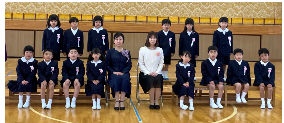
りりしい表情の新一年生

14名の新入生は全員元気に登校し、しっかりと式を終えることができました。新型コロナウイルス感染症拡大防止のため、規模を縮小した式といたしましたが、お忙しい中ご臨席いただきました来賓、保護者の皆様に深く感謝いたします。