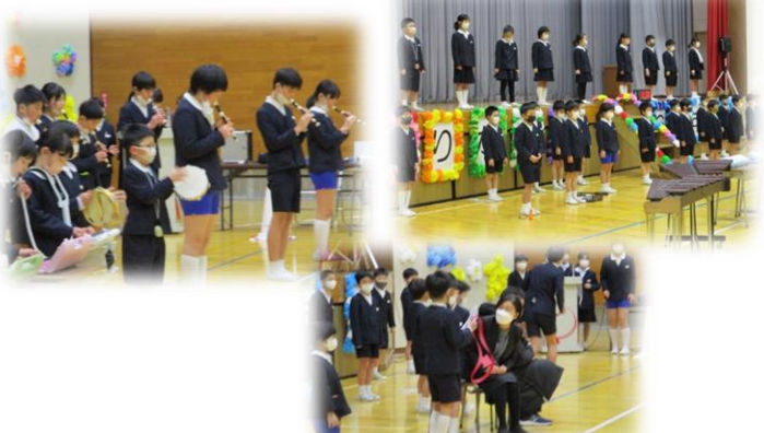
2年生「6年生といっしょに！」