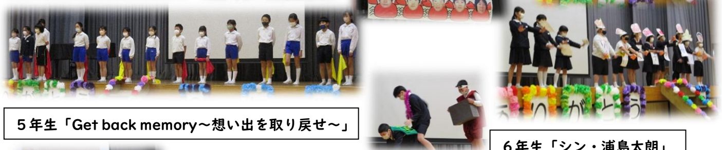
5年生「Get back memory～思い出を取り戻せ～」