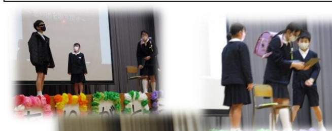
5年生「Get back memory～思い出を取り戻せ～」