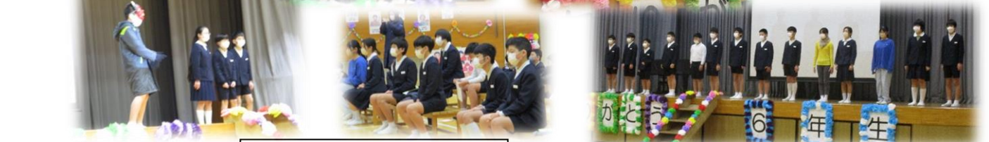
6年生へのプレゼント渡し