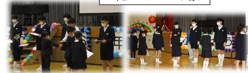
6年生へのプレゼント渡し