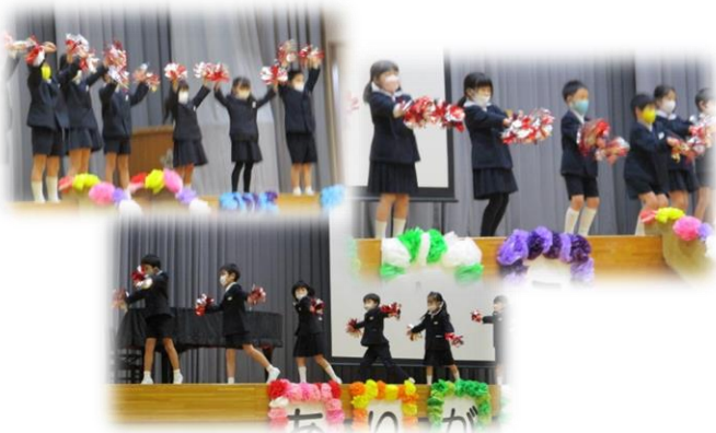
1年生「6年生にサチアレ！」