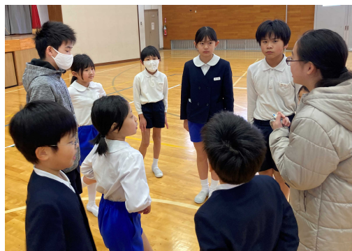
高学年が中心になってチームで作戦会議