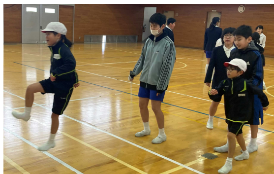
縦割り班で励まし合い年生も上手になりました