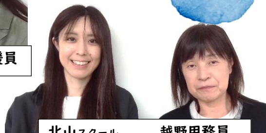
北山スクール サポートスタッフ 越野用務員