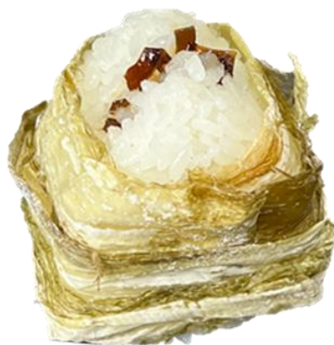
こんぶ昆布おむすび