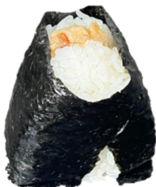
石川サワラのほぐし味噌おむすび

手がけている「六星」の皆さんです。田畑での「稲を見る目」と、販売現場での「お客様の声」を日々体感している「六星」だからこそ編み出された「海むすび」。石川の恵みが詰まった3品です。