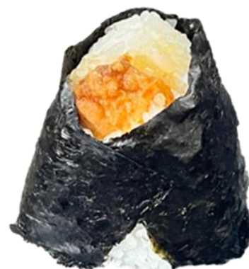
輪島ふぐの唐揚げおむすび