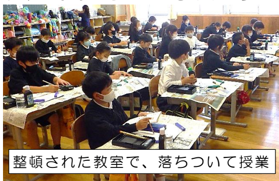
整頓された教室で、落ちついて授業

先月、話題としたあいさつについては、春と同様、さわやかなあいさつができる子が多いと感じています。