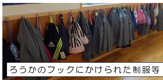
ろうかのフックにかけられた制服等