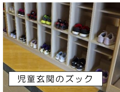
児童玄関のズック

校内を見て回っていると、あちらこちらできちんと整頓されている場面を見ることができます。まず児童玄関のげた箱。はき物がきちんとそろって、見ていて気持ち良くなります。