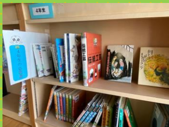
各学年の必読書コーナー