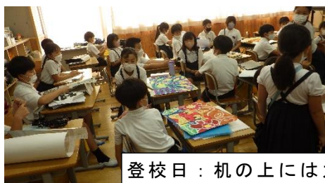
登校日：机の上には力作の宿題がいっぱい！

「(あ) 安心 (し) 信頼 (た) 楽しい あした (明日)のある学校」の「楽しい」を感じる2学期になることを期待しています。勉強するにも、遊ぶのにも、みんな楽しい事を願っているに違いありません。楽しくない勉強、スポーツ、遊びを進んでやりたい人はいないと思います。ただ「楽しさ」にもいろいろあります。何もせずに楽だから楽しいとか、人がいやがることをして困らせたり(× これは、いじめ！)、人の失敗を笑ったりして楽しいとか、こういうのは良い楽しさなのではないでしょうか。(いいえ、違います！)