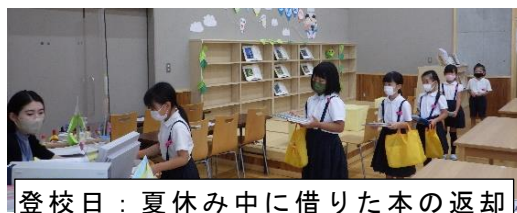
登校日：夏休み中に借りた本の返却

長かった夏休みも終わり、今日からいよいよ2学期が始まりました。子どもたちの元気な様子を見ると、たくさんの思い出ができたようです。また、先週の学年登校日で提出された宿題の研究や作品等を見ると、一生懸命がんばった様子が伝わってきます。夏休みという長期の休みがあったからこそ、じっくり取り組めたという力作が多く見られました。