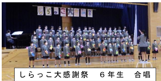
しらっこ大感謝祭 6年生 合唱

『有名な木登りの名人が、弟子を高い木に登らせ、枝を切らせていました。木の高い所の危ない時には、名人は何も言いませんでしたが、弟子が木から降りてくる途中、低い高さになったときに「気をつけて降りなさい。」と声をかけました。それを見ていた作者の方は「これぐらいの高さなら、飛び降りても大丈夫なくらいなのに、どうしてそんなことを言ったのですか？」と尋ねました。すると名人は「目がくらむような危ない高さでは、登っている人も自分で注意をしますから何も言いません。失敗は、危なくないと思った時(油断した時)に、起こるものです」と答えました。』 …というお話です。(簡略引用)