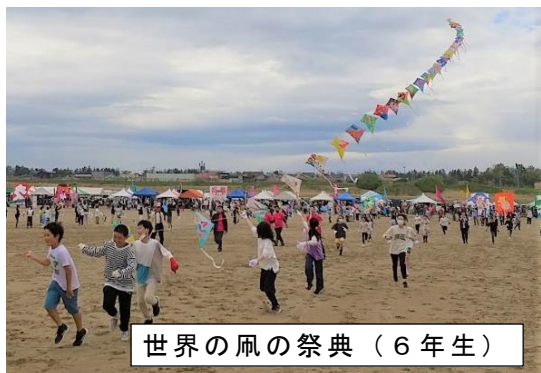
世界の風の祭典(6年生)

5月中旬から徐々に暖くなり、時には暑く感じる日もありました。令和5年度がスタートから2カ月が経ち、進級してからほんの2カ月間ですが、それぞれの学級において、子供たちの成長を感じることができます。1年生は、45分間の授業に慣れてきたようすし、6年生は白帆台小の最高学年という自覚が身についてきたことが、分かります。