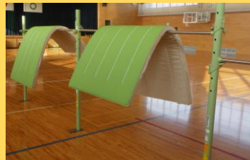
○鉄棒設置しました