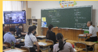
子供主体の授業づくり