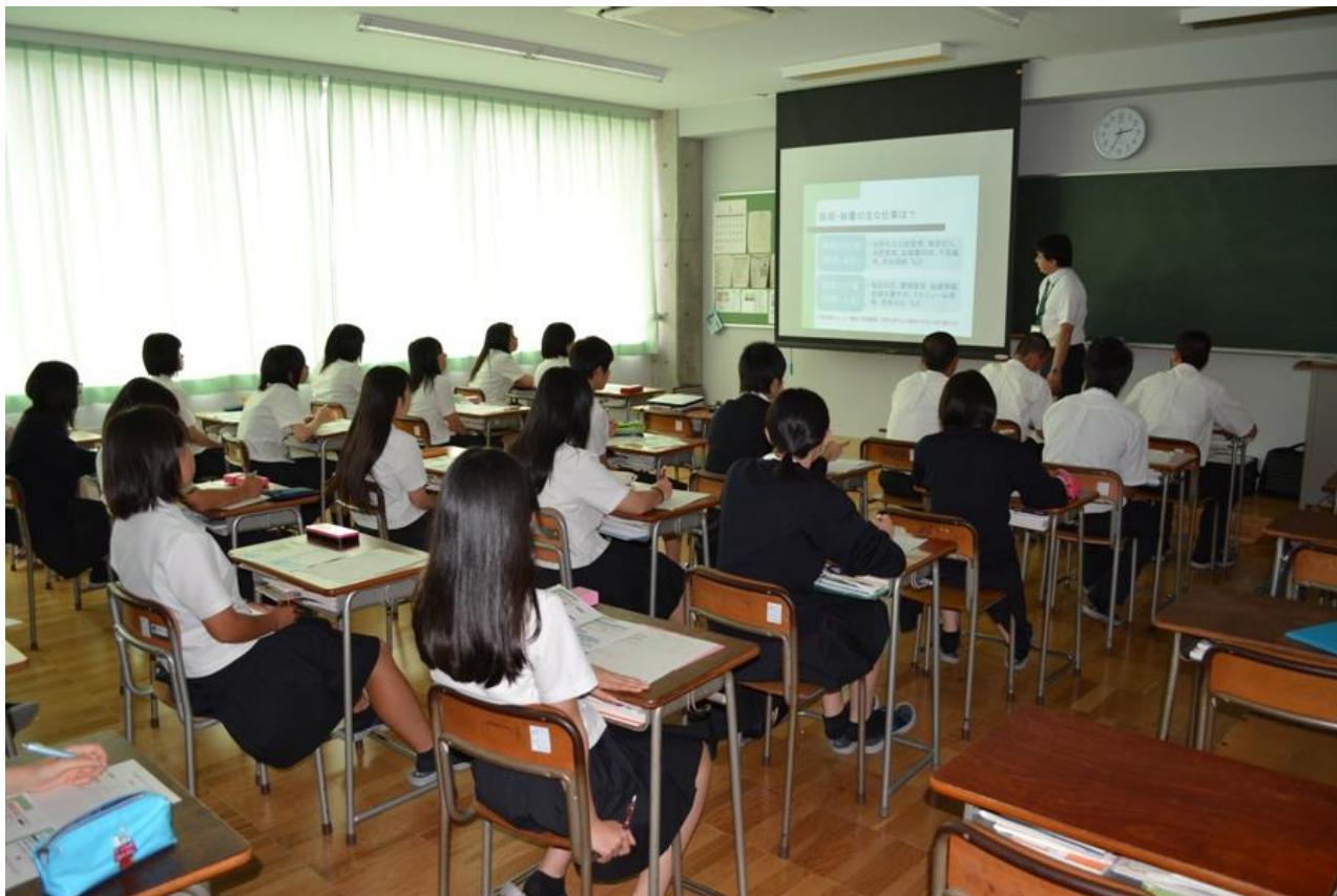
星稜大学女子短期大学部