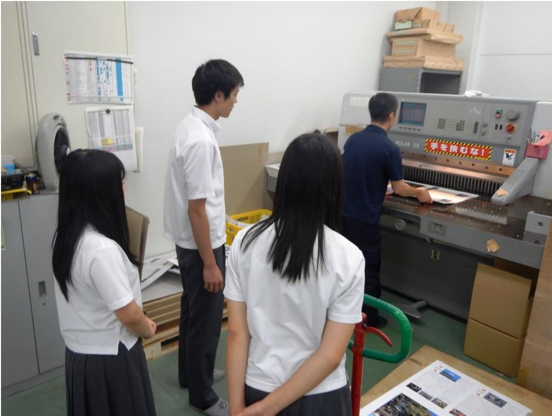
製本室で、金商の卒業生に遭遇しました。

2015/7/27 インターンシップ1日目 第30班(3名) 安達写真印刷株式会社 ※平成27年度インターンシップは、49班136名参加(49の企業等で就業体験)