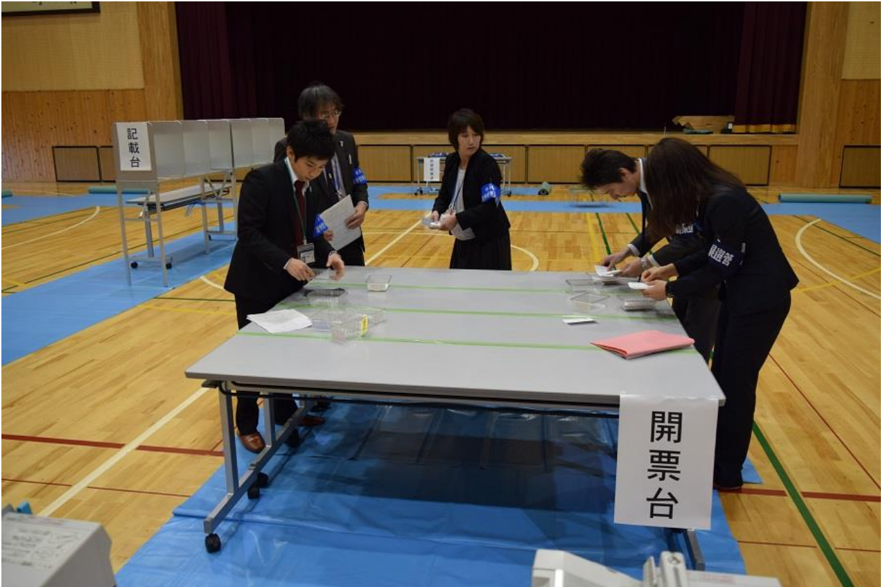
選挙開票マシンが活躍