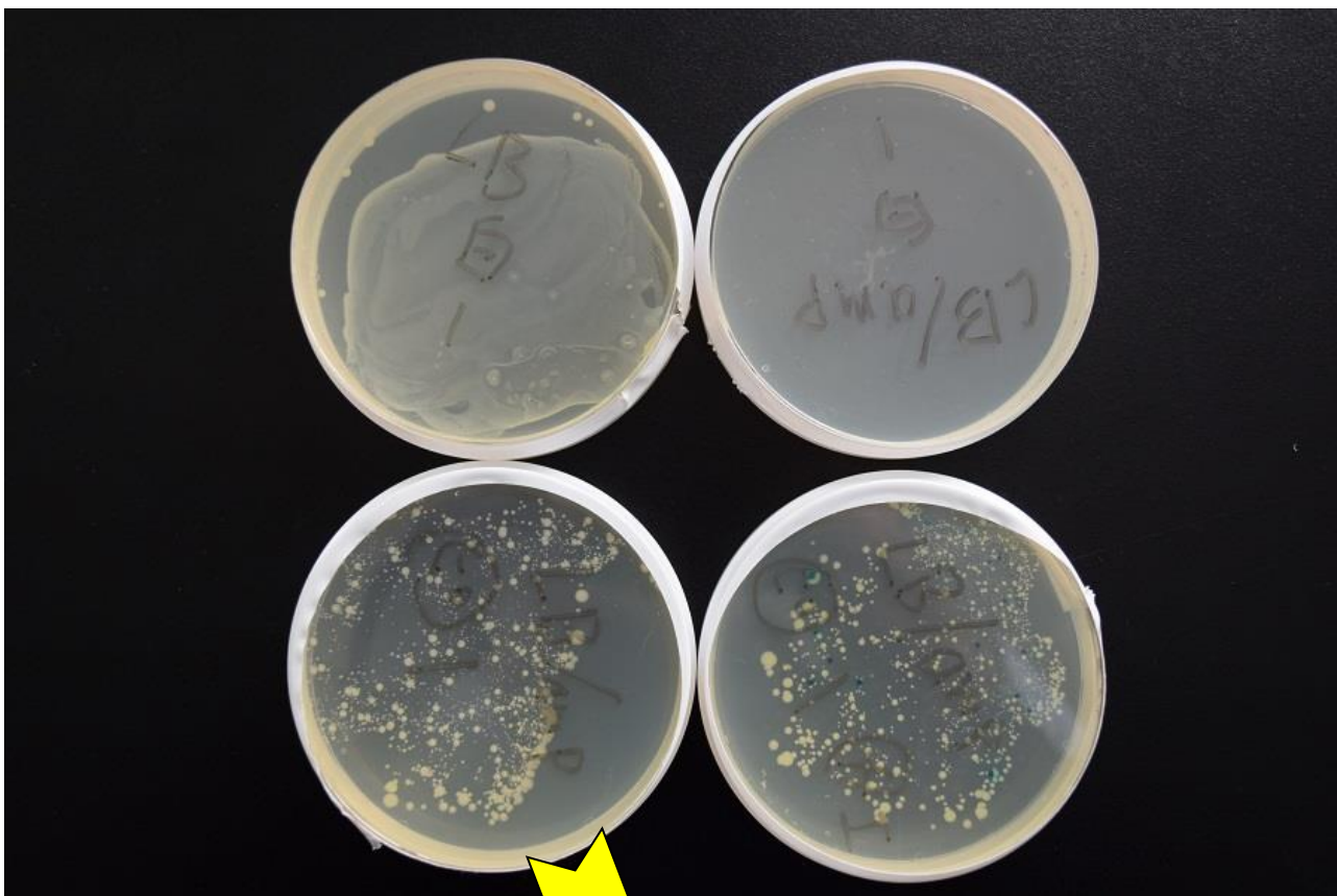
↑一部青い発色が見られる。 (組み替え遺伝子の発現が誘導された。)