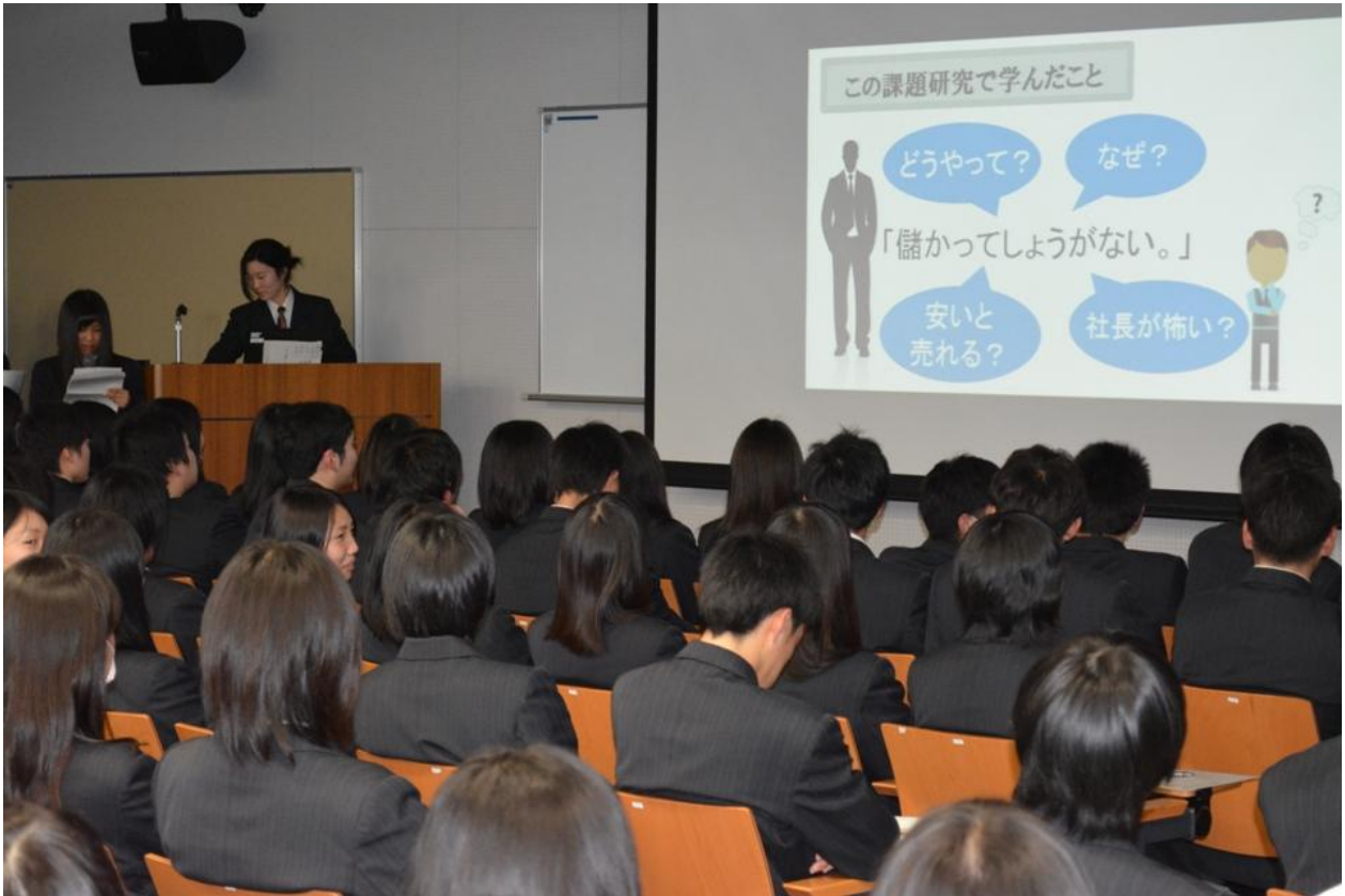
5 「国立大学合格体験記」