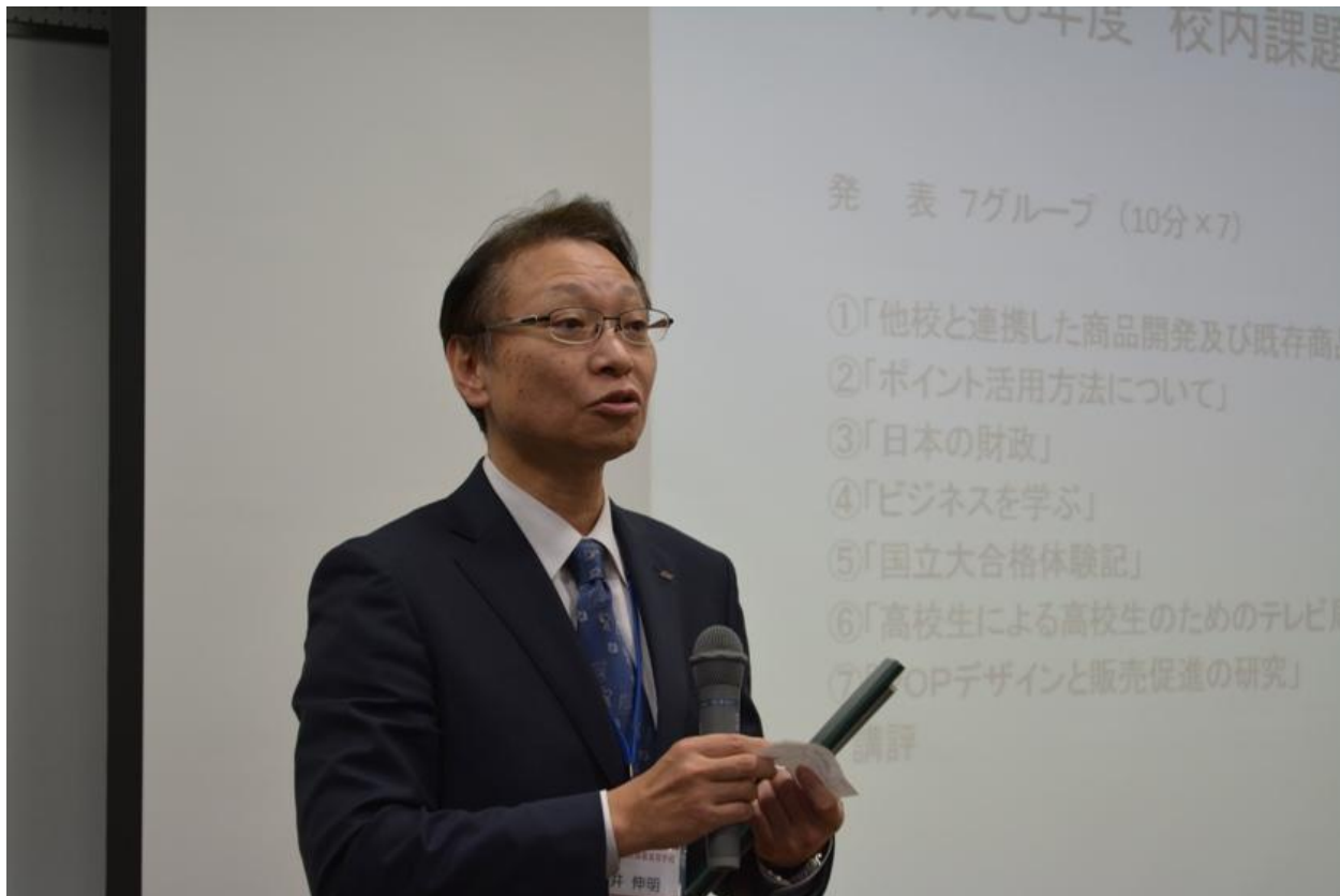
1 「他校と連携した商品開発及び既存商品の販売促進」