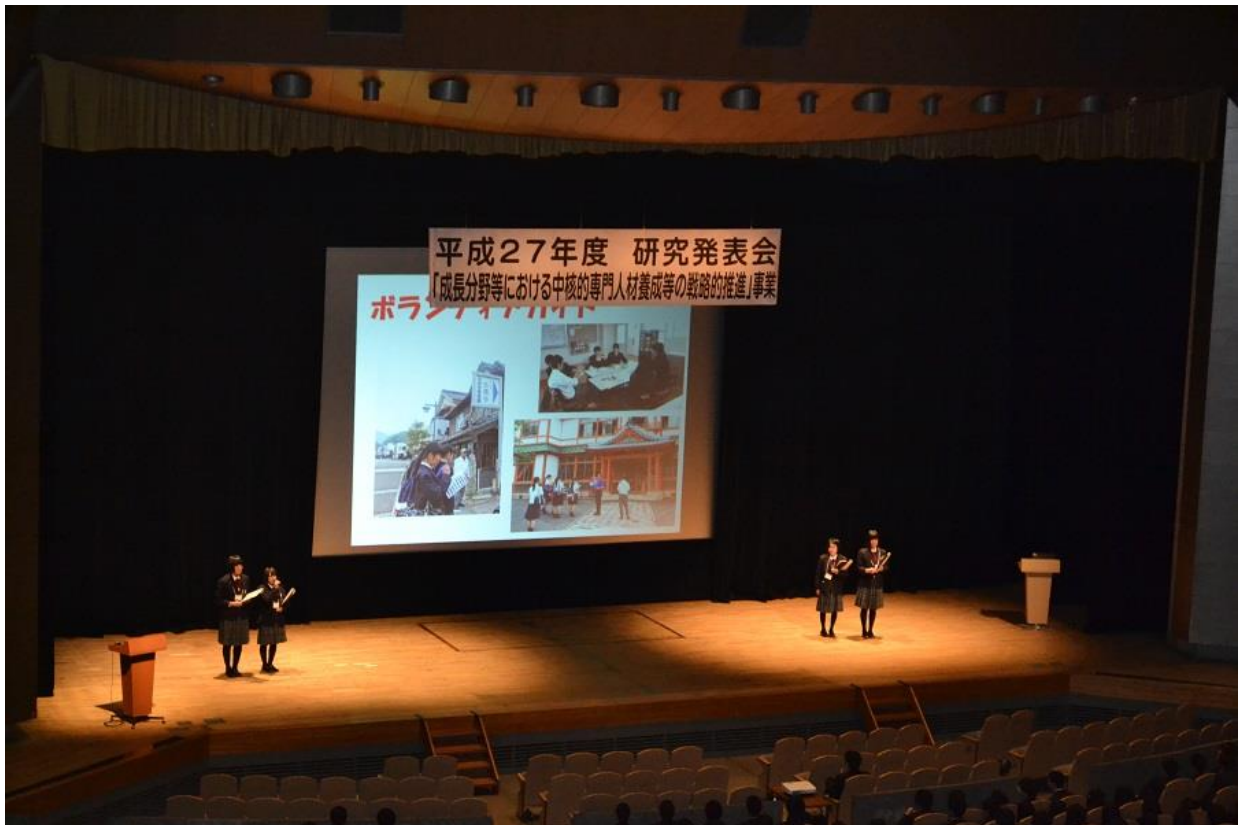
徳島県立徳島商業高等学校 学校紹介