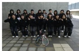
*撮影の瞬間、マスクを外しました