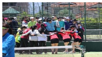
*コロナ感染流行以前