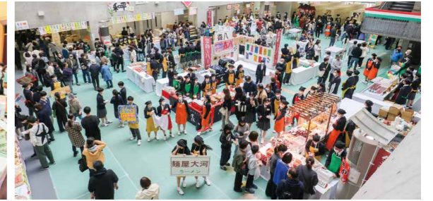
第40回金商デパートの様子