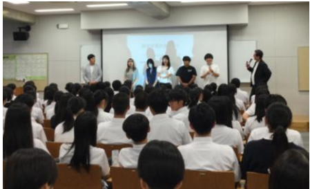
アンカーの皆さんの自己紹介