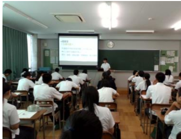
クラス代表者発表会