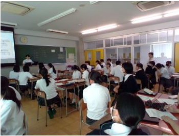
ライフプラン・クラス発表会

9 月 17 日（火）総合的な探究の時間に、グループとクラス、学年で自分自身の「ライフプラン」について発表会をしました。1 年生の総合的な探究の時間の前期は、自分の興味関心を知り、そこから将来の目標につながるコースの選択など、人生を豊かに生きるための課題探究活動を行いました。自分で発表することもそうですが、他の生徒の発表に多く触れることで、様々な職業や進路選択や価値観に触れることができ、新たな角度で自己を見つめることが出来たと思います。24 日（火）には、「課題の見つけ方」について一般社団法人アンカーの皆さんにご講演を頂きました。