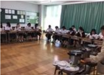
協力店との打ち合わせ

9 月 12 日（木）に金商デパートに向けて、ポスター貼りと、マナー講習会が行われました。「ポスター貼り」では自分の出身校周辺のお店や施設を回り、金デパの宣伝ポスター貼りをお願いしました。緊張したと思いますが、依頼をする際の言葉遣いや態度などを学ぶ良い経験になったことでしょう。「マナー講習会」では服装・身だしなみ・挨拶やお辞儀の仕方などについて、講師の先生にお話し頂きました。また、今年のテーマ最優秀賞には 1 年生の生徒による「おもてなしには心を 接客には感謝を」が選ばれました！心のこもったおもてなしと感謝の伝わる接客ができるように、皆で心を一つにしていきたいですね！！