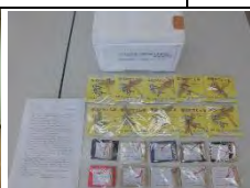
幸福の竹とんぼ、しあわせ呼子