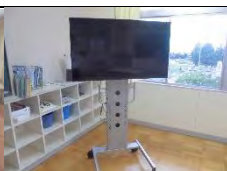
ICT 機器（大型モニター等）