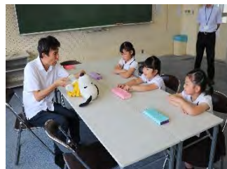
7/16心のサポート授業