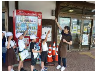
珠洲の名産品を知る