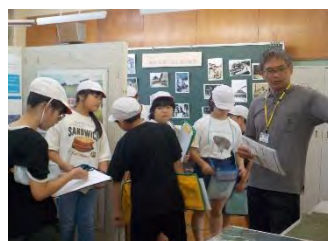
研究の成果を伺う