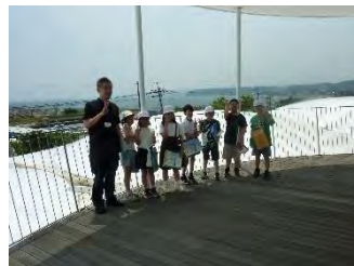
ラポルトの屋上にて