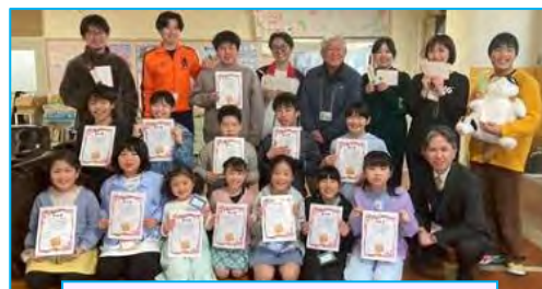
3/28 学びーばさんと集合

さて73日間あった1学期、子ども達はほとんど休むことなく最後まで元気に取り組む姿を見せてくれました。みんなで成長できた1学期になったと振り返っています。おかげさまで10名の子ども達は、楽しみにしていた「夏休み」を迎え、日々満喫して過ごすことができているようです。子ども達にとっての「夏休み」とは、授業から解放された「自由で大切な時間」です。そこで今年も公民館やPTAと連携し、市教育委員会や各種団体の皆様の力強いご支援をいただき、次のような「思い出に残る夏休み」を計画しました。