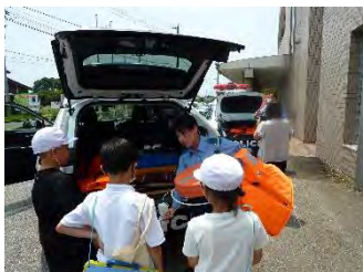
警察車両の備品は何か