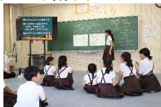
各グループの考えを交流