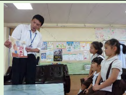
たのしい読み聞かせ

7月から学校司書として、正院小学校には毎週木曜日に勤務しています。いろいろな本に興味を持ってもらえるように少しでもお手伝いできればと思っています。よろしくお願いいたします。