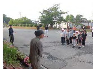
おはようございます

朝6時より親子で奉仕作業を行いました。子どもたちも全員、中学生も参加してくれました。内容は2つ、①運動場倉庫の整理、②旧体育館周りや児童公園の除草作業でした。子どもたちには、花が枯れたプランターの整理と、除草作業のお手伝いをしてもらいました。自分から仕事をみつけ活動することができました。朝から暑さを感じる中、皆さんさわやかな汗を流しながら、熱心に作業して下さいました。敷地内がきれいになりました。ありがとうございました。