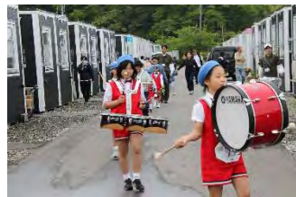
第一団地内パレード