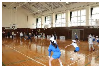
どこからでもかかってこい