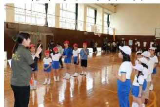
あいさつからスタート

鼓笛パレードの後は、校内相撲大会の代わりとして、昨年度から、ご家族の皆様とのスポーツイベントを行っています。今年は、卒業生も参加してくれました。ドッジボールの親子対決の攻防や巨大オセロゲームでの頭脳戦、新聞のりじゃんけんの結束力など、それぞれのゲームを皆さんが楽しんでいる姿がとても良かったです。