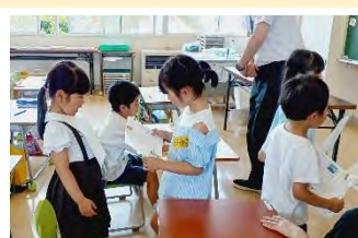
6/17集合学習 1年道徳：意見を直接交流