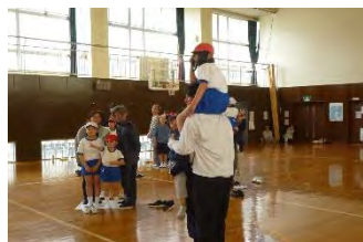
肩車で場所を確保