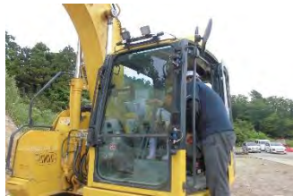
コンピュータ制御