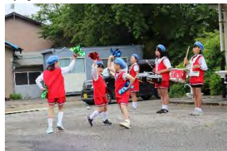
息の合ったダンス隊