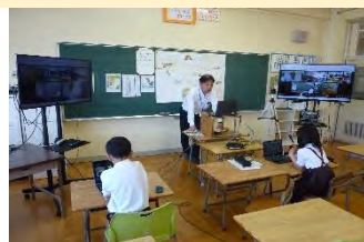
6/17オンライン交流学习 3年国語：多様な考えを交流