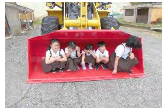
赤いペンキに意味がある

今日は午後特別なお客様が。学校裏殿山の工事をされている株式会社のとさく様とコマツ石川様5名が来校され、工事で活躍した油圧ショベルと、冬季に活躍する除雪機を持ってきて下さって乗車体験を行って下さいました。2班に分かれ、1人1人それぞれの機械に乗車させていただきました。乗る機会も、乗って走ったり操作したりする機会はなかなかありません。建設機械もIT化が進み、GPSやセンサーを組み合わせて、山の掘削を数mm単位で行うことができるそうです。操縦室はエアコンもあり、快適に過ごせるそうです。貴重な機会を子どもたちは笑顔で楽しんでいました。