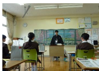
担任からのメッセージ