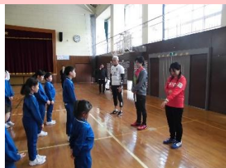
2/25 HEROs スポーツ教室