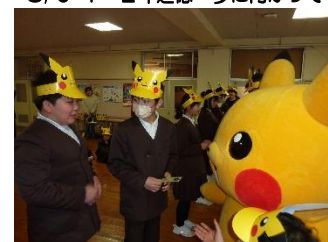
3/12 ピカチュウずまいるキャラバン