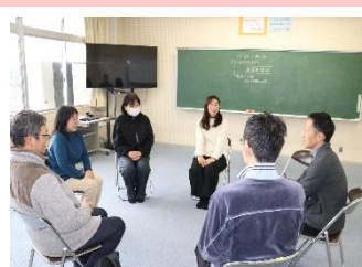
2/26 SCによる保護者講話