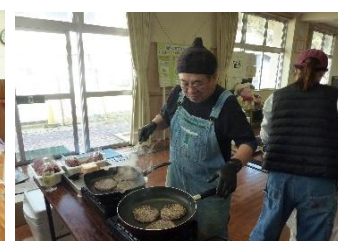
ハンバーガーのふるまい