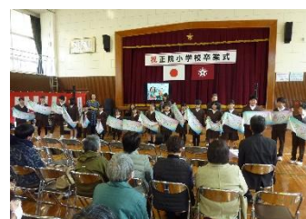
ハレルヤ全員合唱