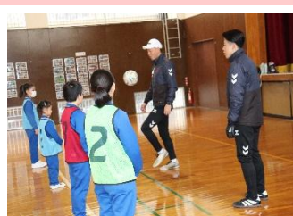
2/28 ツエーゲンサッカー教室