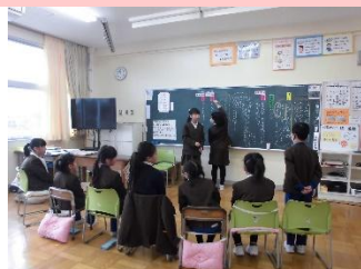
2/26 集会所交流の相談