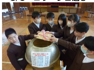
3/11 タイムカプセル封入