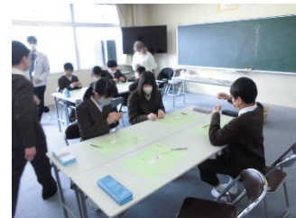
3/5 6年 アクセサリーづくり