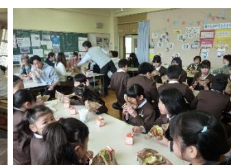
おいしいの声があちこちから