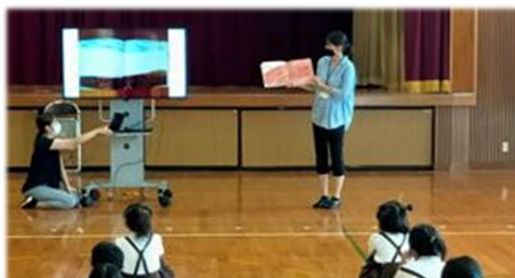
平和に関する絵本の読み聞かせも行いました。

今年度は、8月5日(金)が本校の全校登校日でした。簡単なスライドを作り、以下のような、話をしました。