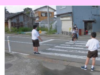
9/1~9/7 グッドマナーキャンペーン