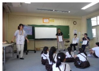
めざす姿のモデル劇