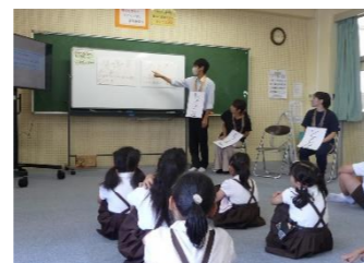
めざす説明の仕方