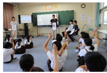
自分の考えを発表

お昼の掃除や正タイムを行わずに学習集会を行いました。本校では学校研究として、算数科を中心として、説明・記述力を向上させる取組を行っています。今回は児童との合言葉「明日を夢見てすすんで学ぶ正院小学校」の【すすんで学ぶ】について、児童と共に考える時間を作りました。2学期は【夢について考え語る姿】、【すすんで学び、正しく説明・記述する姿】を求める取組をすすめていきたいと思ひます。