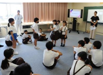
考えをお互いに交流