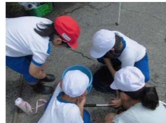
バケツに入れ観察