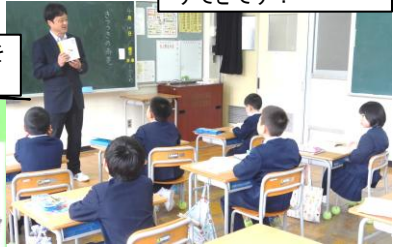
6年生意見をまとめています！さすがです！