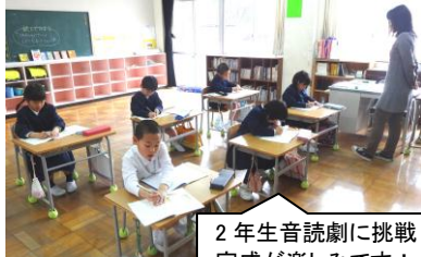
2年生音読劇に挑戦！完成が楽しみです！