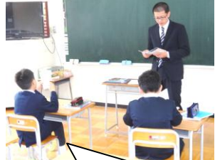
4年生、暗唱練習中！校長室で紹介を待っています！