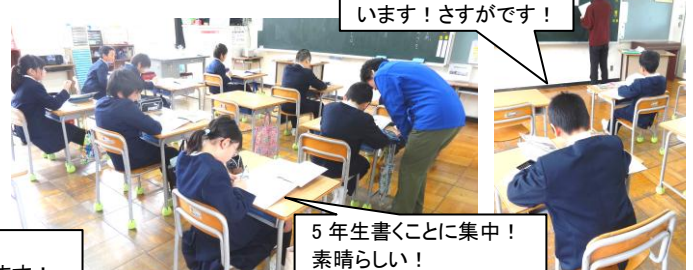
5年生書くことに集中！素晴らしい！