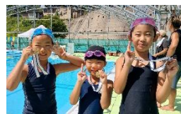
大会新記録を樹立した子どもたち

9月7日(日)に開催される白山野々市学童水泳記録会に、今年も白峰小学校から5名の児童が参加します。最後まで頑張る姿を楽しみにしています!!