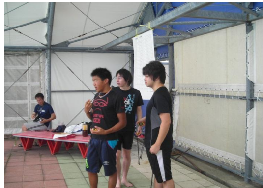
お手伝いしていただいた卒業生のみなさん (ありがとうございました)