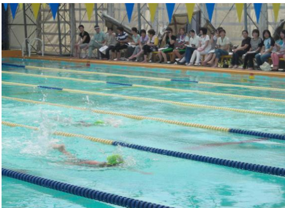
たくさんの応援をいただきました。 (ありがとうございました)

交通安全やクマ、病気に気をつけて9月1日には元気な顔で登校できるようにしてください。