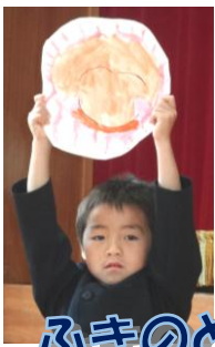
ふきのとう音読劇