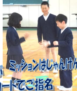
ミッションはじゃんけん

お見事!子ども達が勝ち負けのないゲームを作りました。低学年に高学年がスキンシップを図る温かいゲームでした。関係作りの自主的進展を期待しています。