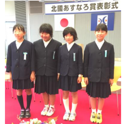
北國あすなる賞表彰式

ふるさとに育まれている全校の子ども達の実践活動が認められました。本校の誉がまた一つ積み重なっていきます。「あすなる」...「あすは立派なヒノキになるう」 全ての子の明日を常につかり見つけ続けます。