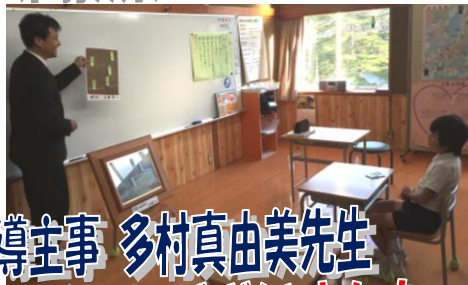
金沢教育事務所 指導主事 多村真由美先生