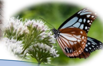
日本の渡り蝶 「アサギマダラ」

先日テレビを見ていたら、アメリカの渡り蝶「オオカバマダラ」の特集をしていました。その姿は黒い縁にオレンジ色で、色は違ってもアサギマダラにそっくりでした。幼虫もアサギマダラの幼虫とそっくりでした。違いは、アサギマダラは一世代で南下と北上をしますが、オオカバマダラは、3～4世代を重ねて北上し、秋に一気に南下するところです。こんなことにも興味が沸き、外小のフジバカマとアサギマダラの活動ができたことは、今年一番の思い出になりそうです。