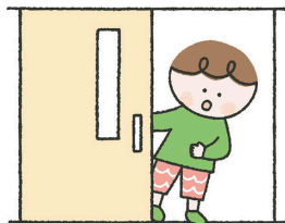
1日の平均利用者数