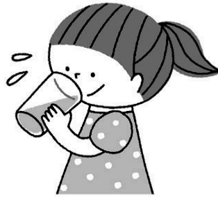
喉が渇く前にこまめに水分をとる