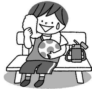
運動するときはこまめに休憩をとる