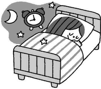
規則正しい生活で体調を整える