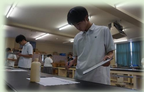
日頃の学習の成果を力試し!

チームが一丸となって取り組み、迅速かつ正確な測量を目指して、炎天下の中で、頑張りました!