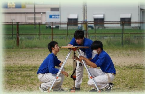
目指せ全国大会!(平板測量競技)

7月の体験入学は、実習風景を見学です。キビキビとした動きで作業する先輩はとてまっかっいいい!