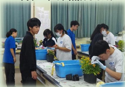
ミニ花壇を作ろう!

8月の体験入学(造園分野)は、コケ玉作りに挑戦!自分で作ったコケ玉は、かわいくて、いとおいしい!