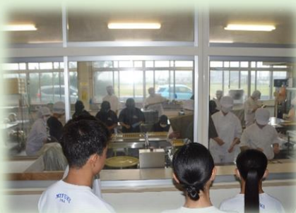
先輩の姿はまぶしい!

7月の体験入学は、実習風景を見学です。キビキビとした動きで作業する先輩はとてまっかっいいい!