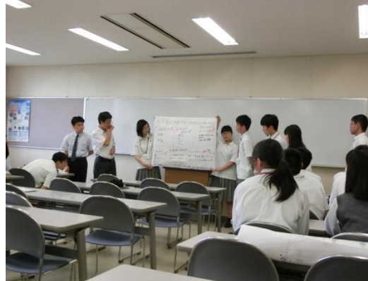
意見交換会の様子 (R1)