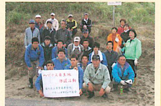
活動で、あさがおTVやNHKでも放送されました。私たち「グリーンデザイン研究会」は、白山市以外でも金沢市「下安原ハマナスの会」や能美市のボランティアの方々と地道なハマナス保護活動を行ってきました。その結果、平成18年度ボランティア・スピリット・アワードでコミュニティ賞(石川県で優秀なボランティア活動)を受賞しました。また、平成19年度ボランティア・スピリット・アワードではブロック賞(北信越で優秀なボランティア活動)を受賞しました。その結果、東京で年末に行われた全国授賞式に参加しましたが、全国トップ10には入りませんでした。

「ごけんちよう山」は白山市竹松海岸にある倉部川河口より南側にのびる海岸砂丘の山です。通称「ごけんちよう山」で、漢字での表記は確かではありません。昔は一面にハマナスが咲き誇る山だったそうですが、様々な問題からハマナスが減少し続けています。また、このハマナスは白山市の天然記念物に