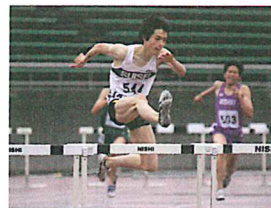
国体石川県予選 400mハードル 優勝 (秋田国体出場)