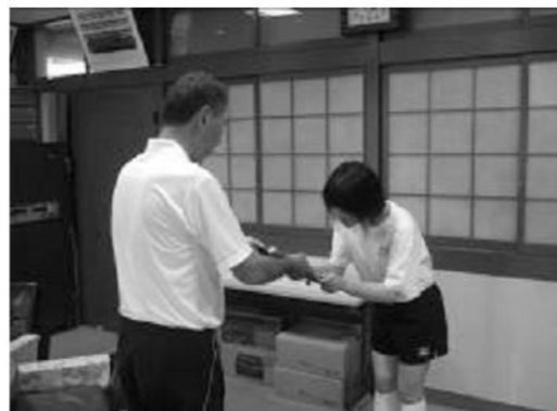
【グッドマナーチーム特別賞受賞の様子】

感謝の気持ちを形で表すことができれば、その気持ちは相手に伝わります。態度で、言葉で「ありがとう」。最近ちょっとできなくなったなという人は、もう一度意識的に続ければ、自然にできるようになります。すれば良かったと後悔しないように、自分もさわやかな気持ちになれるように、実行しませんか。