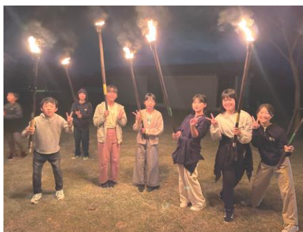
夜のキャンプファイヤーってきれいで楽しいね！