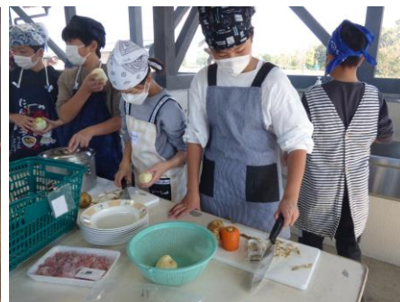
おいしいカレーになるようにみんなで協力！