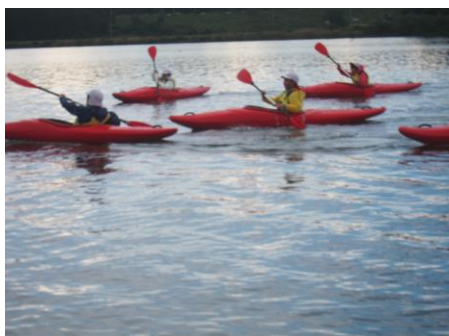
カヌーって楽しい！すいすい進むよ！

2日間で得た経験を、今後に活かしていきましょう！保護者の皆様、準備等本当にありがとうございました。