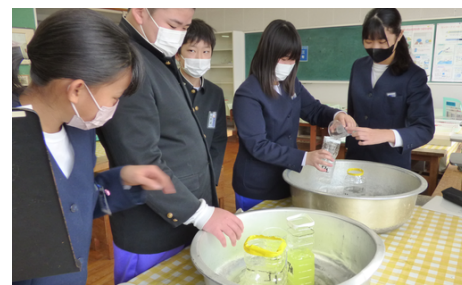
【タブレット端末を使いこなす1年生】 【自分で学習するときは集中！真剣！】 【みんなで力を合わせて解決もOK】