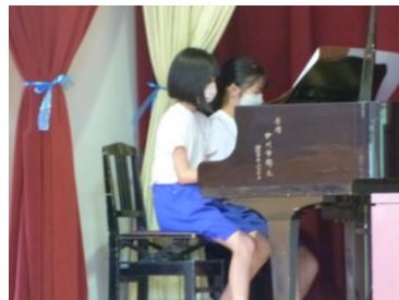
〇〇〇さんと〇〇〇〇 さんの連弾です♪