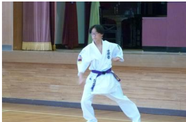
〇〇〇〇さんの空手。 基本型4の型を披露しました。