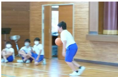
〇〇〇〇さんのバスケット。 レイアップシュートです。

6月24日（金）の児童集会で、児童の特技を発表しました。学校だけでなく、学校以外でも自分の好きなことに向かって努力している児童がたくさんいます。今回は、バスケット、空手、ピアノの演奏を6年生が披露してくれました。これからも自分の好きなことに向かってがんばってほしいです。みんな、かっこよかったです！