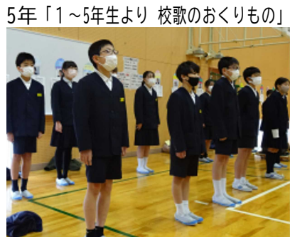
5年「1～5年生より 校歌のおくりもの」