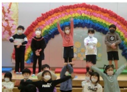
1年「ハッピープレゼント」

本校の教育活動に対する保護者や地域の皆様のご理解ご協力により、無事に年度末をむかえることができました。ありがとうございました。次年度もよろしくお願いいたします。