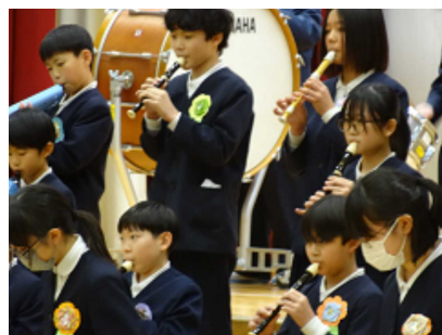
6年「感謝 -1～5年生へエールをそえて-」