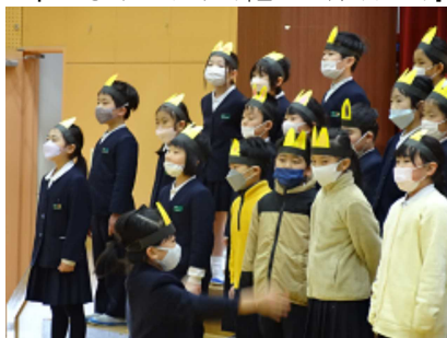
2年「にぎつねコンサート（6年生へとどけ、ありがとう）」