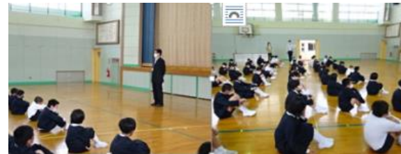
[18日の各教室の様子]

②については、できたかどうか挙手で確認すると、約2/3の児童が手を挙げてくれました。